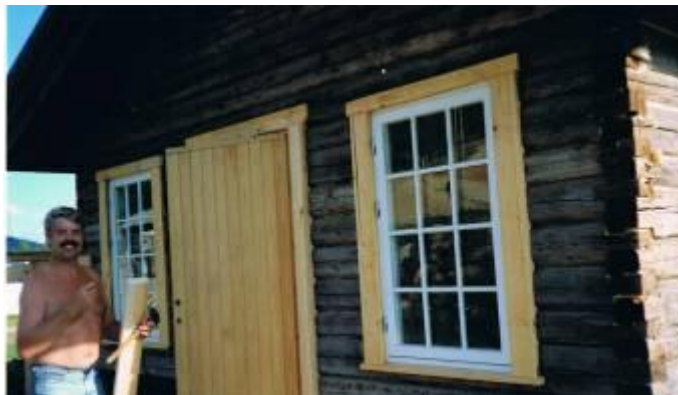
Dette er et bagstuehus altså er bageri, jeg opførte.

Møgvej, det sjaskregner, men jeg får tagudhænget gjort færdig. Jeg er totalt gennemblødt og kold, så jeg går ind under den varme bruser, for at få var-men igen, det lykkes. Leif går og tager afsked med "Mor Danmark", afmontere det han skal have med hjem, og pakker det over i "Den Lille", hvorefter det så var meningen, at vi skulle trille sydover, men den gik ikke. Man rejser ikke fra Strand Fjellstue på tom mave så afskedsmiddagen bestod af hakkebøf på brød med sur/søde agurker og tomater.