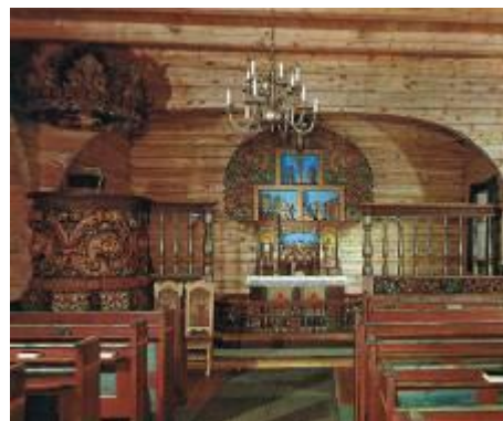
Koret og alteret i kirken.

At en Københavner havde været på Valby bakke og så pralede med at have været i Danmark -, sådan tak for kaffe!