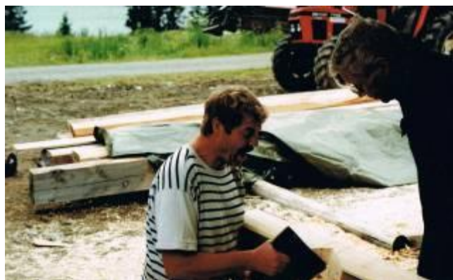
Jo, det hjælper at synge når man lafter .

Vi ser desværre ikke mere, men pludselig går det op for os, hvad der i grunden er sket.