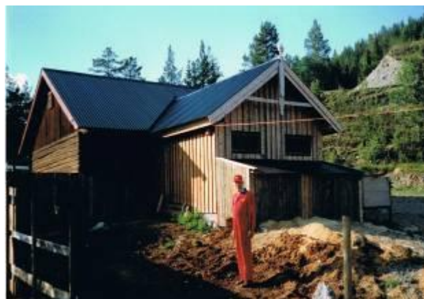
Stalden med udbygningen, som vi lavede.