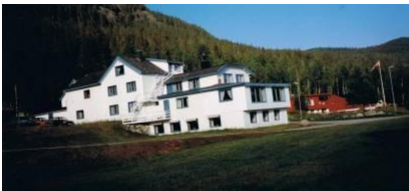
Skønne "Strand Fjellstue".

Overalt ligger der noget, der mest af alt ligner ihjel kørte ællinger, - men det er lemminger, stakkels dyr. Der begynder at være is på elvene og da vi når op til Espedals-søen er isen omkring 1 m tyk.