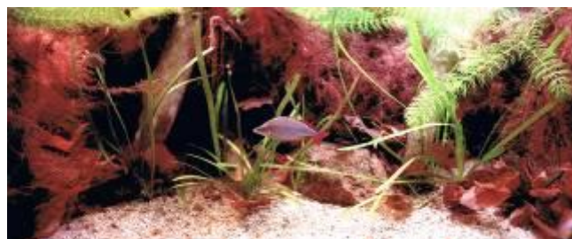
Nr. 1 ved DM, klasse 6, Arts akvarie for avls fisk