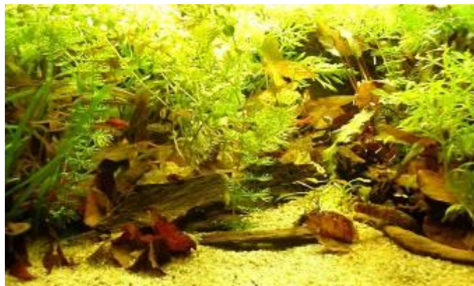
Nr. 1 ved DM, klasse 4, Biotop akvarie