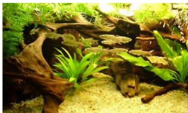
Nr. 1 ved DM, klasse 5, Arts akvarie