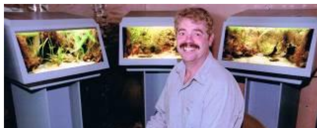
Den glade 3 dobbelte Danmarks Mester.