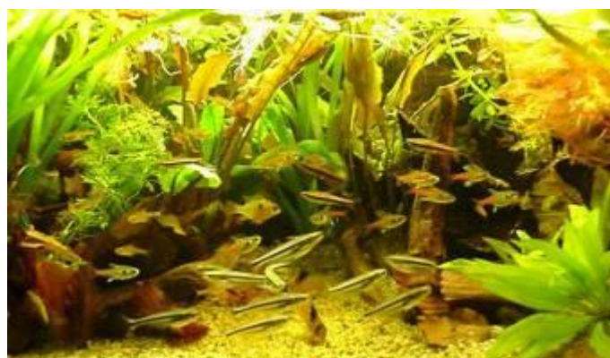
Nr. 2, ved DM, klasse 3, Biotopisk prydk akvarie