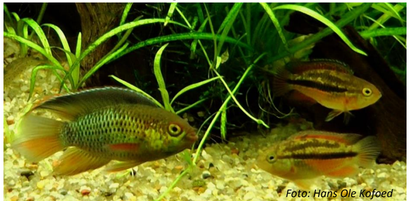
Nannacara anomale han og 2 hunner i mit pyrdakvarium

Når legen nærmer sig, ses det tydeligt på hannen. Hans farver bliver mere intense, det gyldne skær gløder, og de blågrønne farver bliver stærkere og mørkere, ligesom finnerne nærmest bliver blåsorte. Han danser bejlende omkring hunnen, og hvis hun er legemoden og villig, skifter også hun dragt og anta-ger nu en mere brunrumset dragt, hvor der kommer nogle mørkebrune pletter mellem overkroppens to bånd, og der dannes nærmest et skakbrætagtigt mønster.